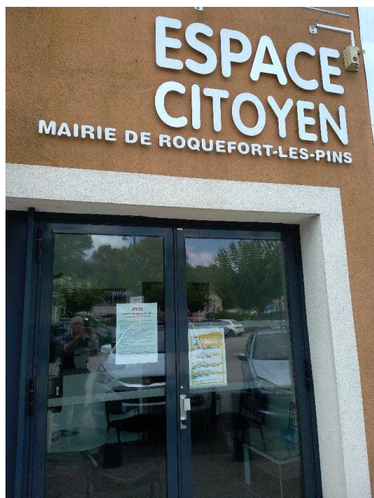
Photo N°4 AVIS CONCERTATION PUBLIQUE attachée à la Main Courante N°2023002228