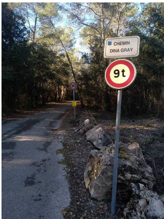
Photo N°6 chemin Dina Gray au niveau du chemin des Lions attachée à la Main Courante N°2024005506

Photo N°5 début du chemin Dina Gray par le chemin Vignefranquet attachée à la Main Courante N°2024005506