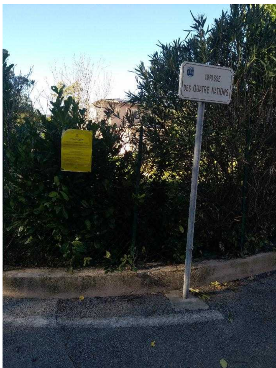
Photo N°8 début du chemin Dina Gray par le chemin du Romanil attachée à la Main Courante N°2024005506

Photo N°7 chemin Dina Gray au niveau de l'impasse des quatre maisons attachée à la Main Courante N°2024005506